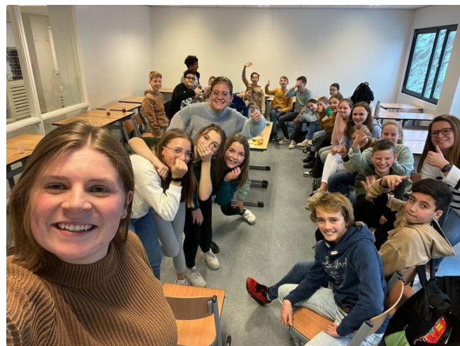
GAH13 genoot ook van het lekkers van de Sint!